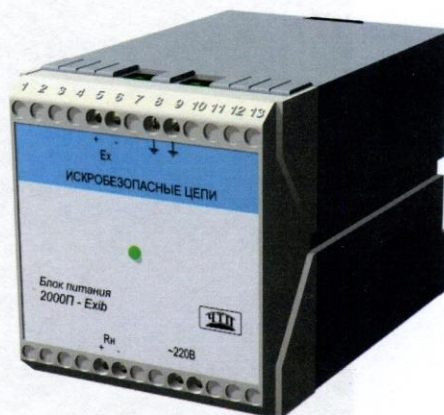
Рисунок 1 - Фотография общего вида 2000П-Ех

Фотографии общего вида блоков представлены на рисунках 1 - 4.