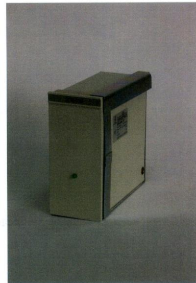
Рисунок 3 – Фотография общего вида БПК-40М